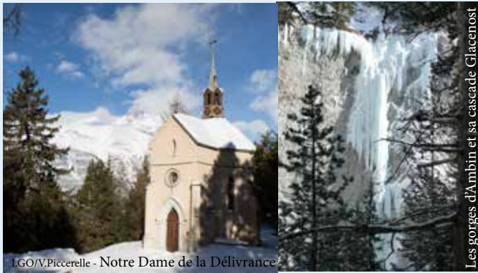
Notre Dame de la Délivrance