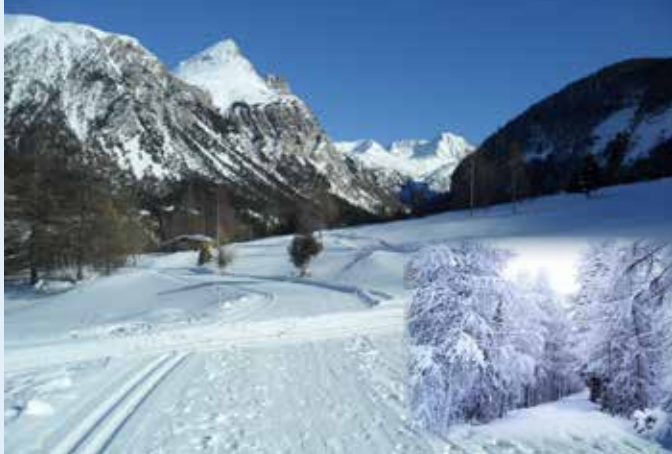
Mairie de Val-Cenis – Pistes du Val d'Ambin